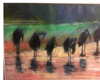
"Stork-spöken" i Krugerparken