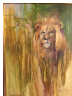
Lejon i Krugerparken