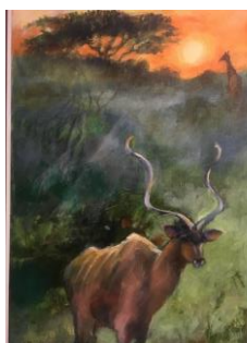
Kudu och giraff