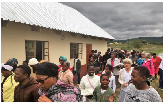
Vandring under sång runt kyrkan i Mgululu

Tack vare öronmärkta gåvor har vi gett ekonomiskt stöd till kyrkorna i Hlane och Mgululu. Den 25/11 2017 deltog vi i invigningen av de två nybyggda kyrkorna.