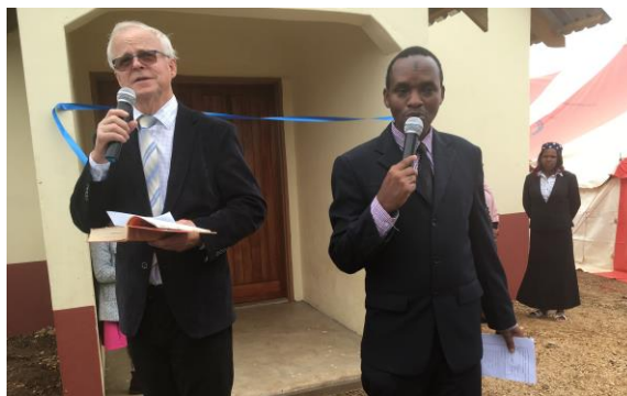
Jag hade förmånen att inviga kyrkorna