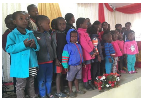
Söndagsskolan medverkade med sång