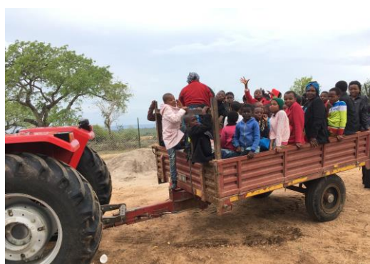
Traktortransport till invigningen i Hlane